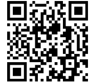
Logo フォーム用 QR コード