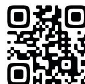
HP 用 QR コード