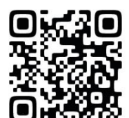
インスタ用 QR コード